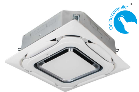
CASSETTE FCAG-B MET UITBLAASPANEEL BYCQ140EP