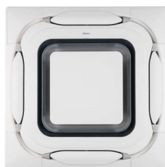
BYCQ140EP Wit designpaneel

Let op: de nieuwe uitblaaspanelen zijn uitsluitend compatibel met de nieuwe "Roundflow" cassettemodellen (FCAG-B, FCAHG-H en FXFQ-B).