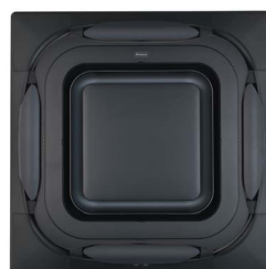
BYCQ140EPB Zwart designpaneel

Daikin Nederland Bel 088 324 54 55 of kijk voor meer informatie op www.daikin.nl .