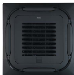
BYCQ140EGFB Zwart zelfreinigend paneel met fijnmazig stoffilter