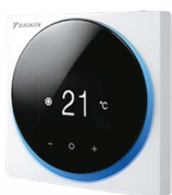
BRC1H519W7 (glanzend wit)