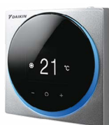
BRC1H519S7 (metallic grijs)