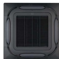
BYCQ140EB Zwart standaardpaneel