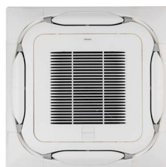
BYCQ140EG(F) Wit zelfreinigend paneel met fijnmazig stoffilter