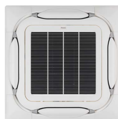
BYCQ140EW Zuiver wit standaardpaneel