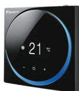
BRC1H519K7 (mat zwart)

*) via de optionele WLAN-adapter BRP069B82. De installatie van een bedrade afstandsbediening is vereist om deze optie voor bediening op afstand te activeren.