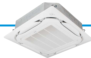
FCAG-B met uitblaaspaneel BYCQ140E