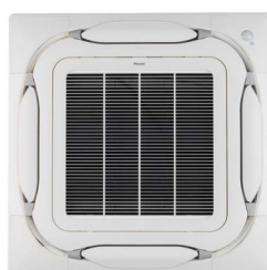
BYCQ140E Wit standaardpaneel